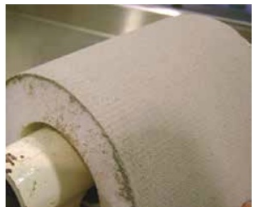
Prueba de Resistencia a la Flexión sin Agrietamiento