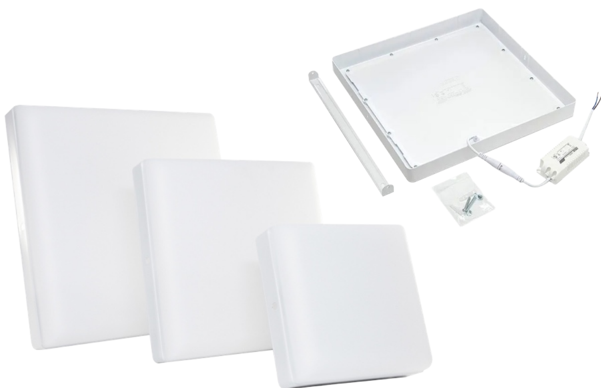
Panel LED Sobrepuesto